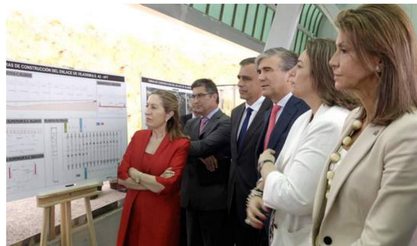
Representes de las administraciones públicas y de abertis durante el acto de presentación del nuevo enlace de Vilademuls.

Con la apertura de Vilademuls, abertis autopistas finaliza la totalidad de las obras del proyecto de ampliación de la autopista AP-7, que ha representado la creación de un tercer carril a lo largo de un total de 78 kilómetros en las comarcas de Girona, y que la compañía ha ejecutado en su conjunto a lo largo de 125 kilómetros entre La Jonquera (Girona) y Vilaseca-Salou (Tarragona). Este proyecto ha dotado a la autopista de mayor capacidad y mejores condiciones de servicio a los usuarios de la AP-7.