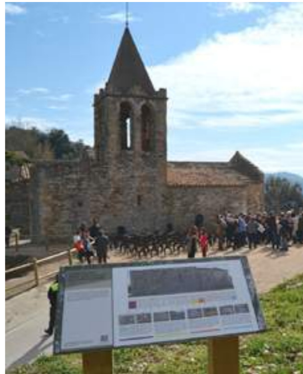
La recuperación del poblado íbero en la montaña de Sant Julià de Ramis es uno de los ejemplos de la contribución de abertis autopistas con su entorno.

El compromiso de abertis autopistas con la provincia de Girona en 2014 supera los 888.000 euros.